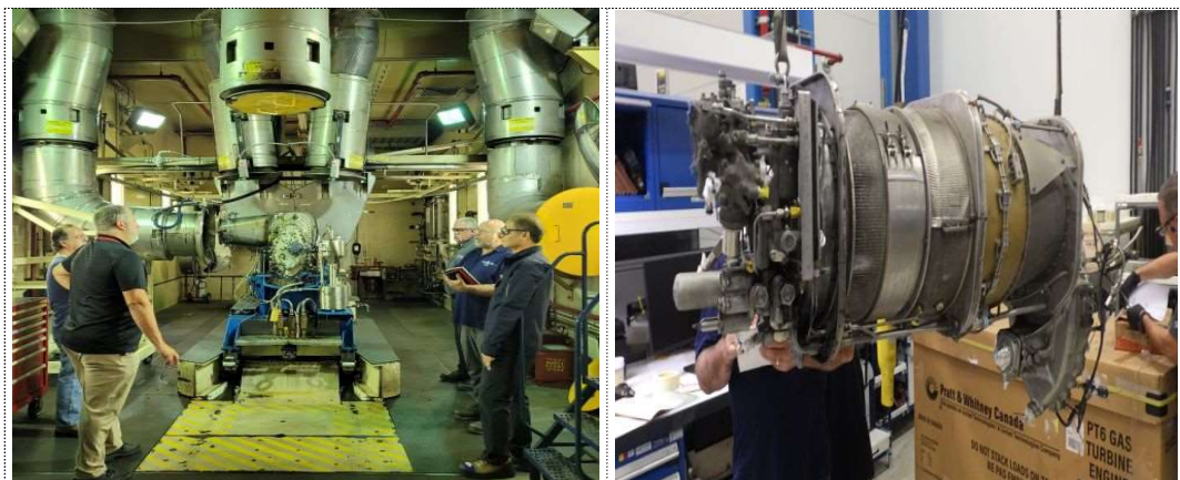
엔진작동 및 분해검사

HL9646의 엔진은 위원회와 엔진제작국인 캐나다 사고조사위원회(TSB) 합동으로 작동점검 및 분해검사 2) 를 하였다. 검사내용으로 각 엔진 및 연료조절 장치의 작동검사, 엔진 정밀 분해를 통한 사고 이전과 이후의 발생 결함 여부 등을 조사하였다. 조사 결과는 최종보고서에 포함할 예정이다.