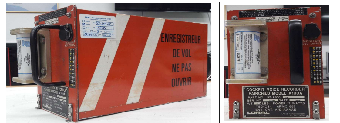
[그림 3] 비행기록장치

HL9646의 비행기록장치는 음성기록장치(CVR)가 장착되어 있었으며, 우리 위원회에서는 이 자료를 인출하여 분석하였다. [그림 3]은 사고 발생 후 항공기로부터 분리한 비행기록장치의 사진이다.