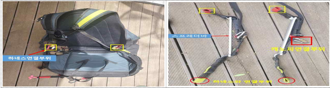
[그림 5] 하네스, 연결바