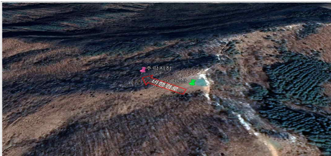
[그림 1] 비행경로 및 추락 지점