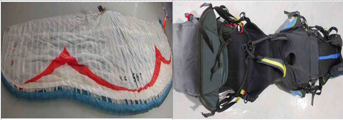
[그림 3] 사고 현장에서 수거한 캐노피, 하네스

위원회가 항공안전기술원에 정밀점검을 의뢰한 검사 결과에서도, 비행에 영향을 미칠 수 있는 특이사항은 발견되지 않았다. 다만, 하네스 줄이 절단된 상태이었으나 119구조대가 지면에 있는 조종자를 구조하기 위하여 절단한 것을 확인하였다.