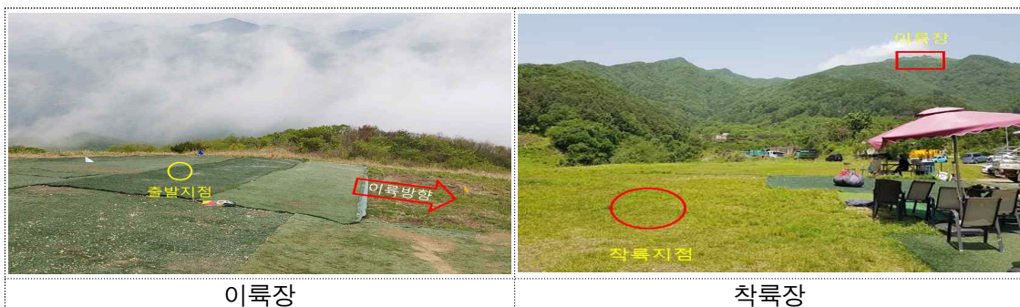
[그림 2] 이착륙장 정보

이륙장으로부터 서쪽으로 약 2.38 km 떨어진 지점에 위치한 착륙장은 [그림 2]와 같이 직사각형 형태의 초지로 구성되어 있고, 바람 방향을 참고할 수 있도록 풍향지시계가 설치되어 있었다.